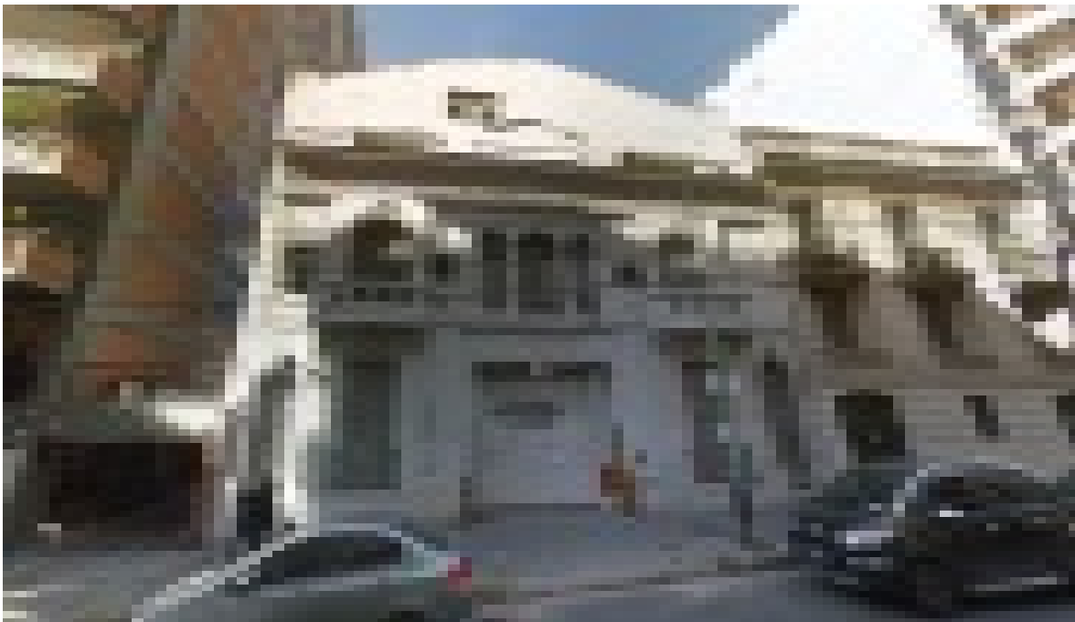
Fachada inmueble BILLINGHURST Nros. 2457/2461/2463