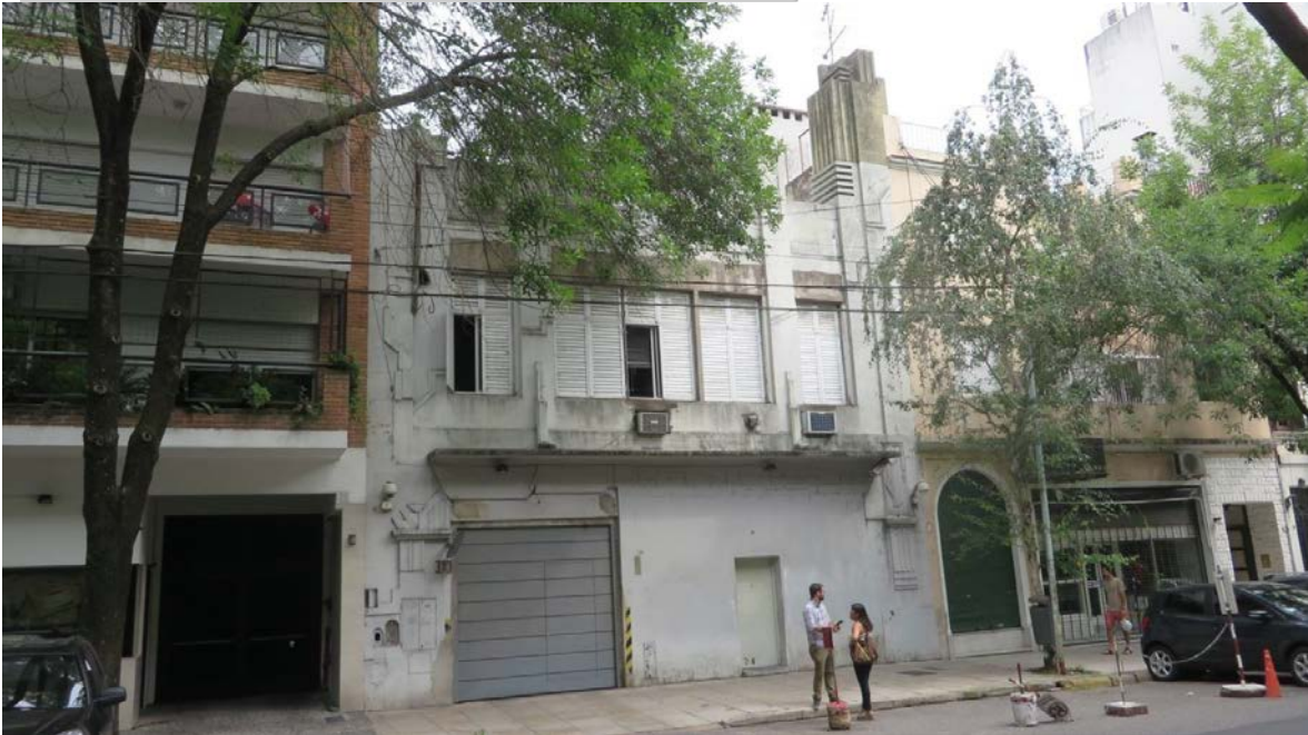
Fachada inmueble SANCHEZ DE BUSTAMANTE N° 2496

Agencia de Administración de Bienes del Estado