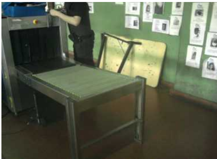
Imagen N° 4:

Las estructuras y patas de apoyo de hierro se deberán pintar con pintura tipo epoxi, color: GRIS CLARO.