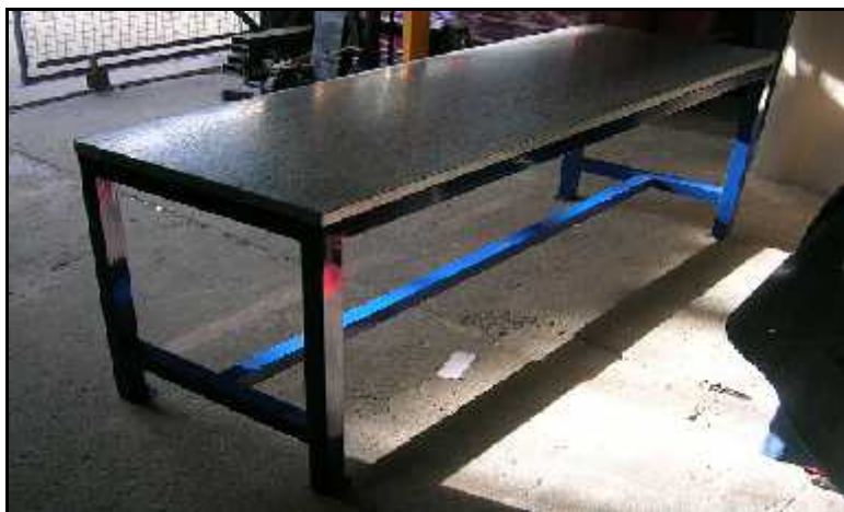
Imagen orientativa: A modo de ejemplo, a continuación se muestra una imagen orientativa de la mesa, la cual no resulta vinculante para la selección.