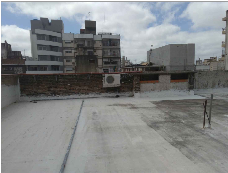
DETALLE 2 mojinete este a revocar

UNIVERSIDAD TECNOLÓGICA NACIONAL Facultad Regional Rosario