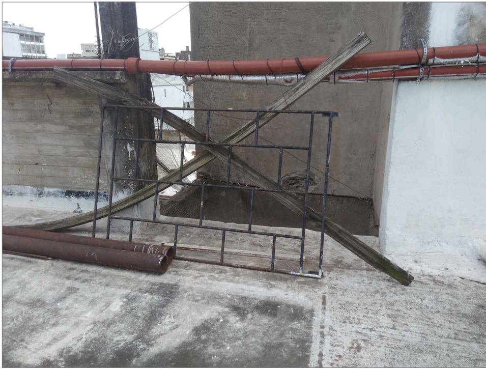
DETALLE 1 mojinete norte