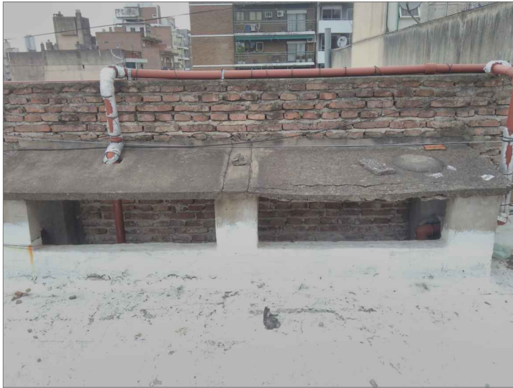
cubierta espacio tecnico