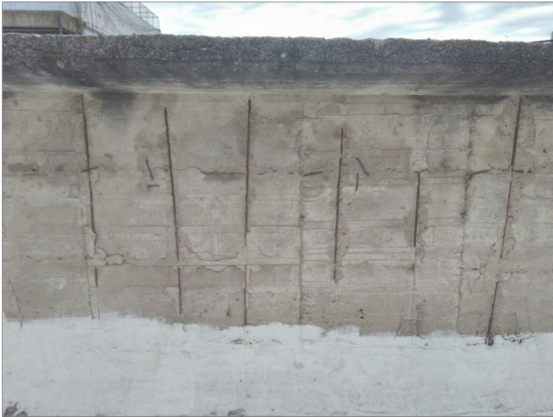
DETALLE 1 mojinete norte y sur a revocar