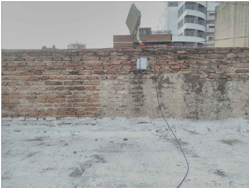
DETALLE 2 mojinete este a revocar

UNIVERSIDAD TECNOLÓGICA NACIONAL Facultad Regional Rosario