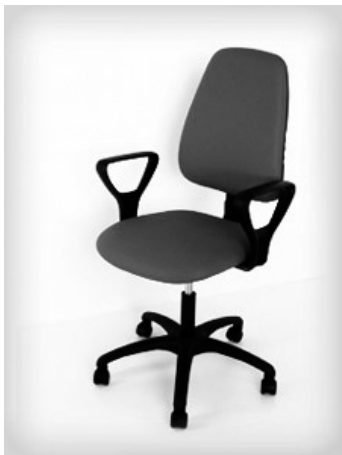
Imagen adjunta del renglon 2