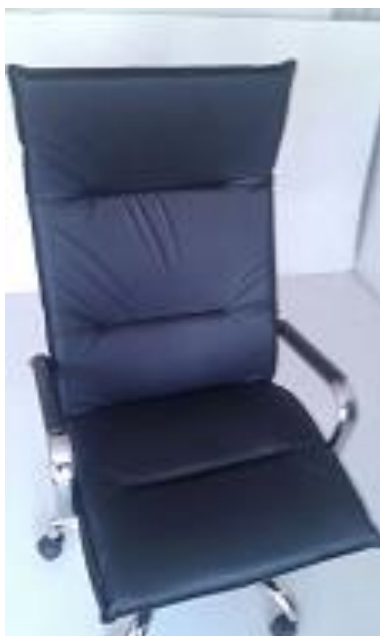
Figura N° 4