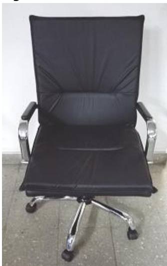
Figura N° 1