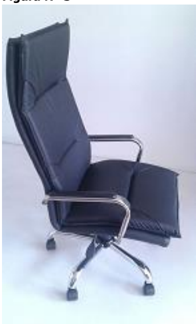
Figura N° 3