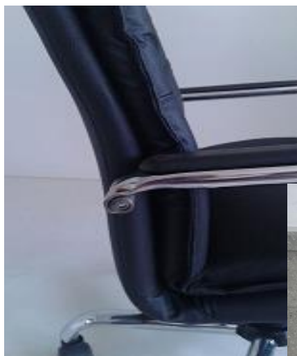
Figura N° 5