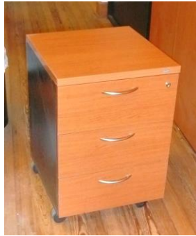
La imagen es a modo ilustrativo