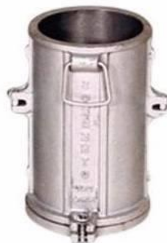
Fig. 8.2 Molde de acero, para elaboración de probetas de ensayo