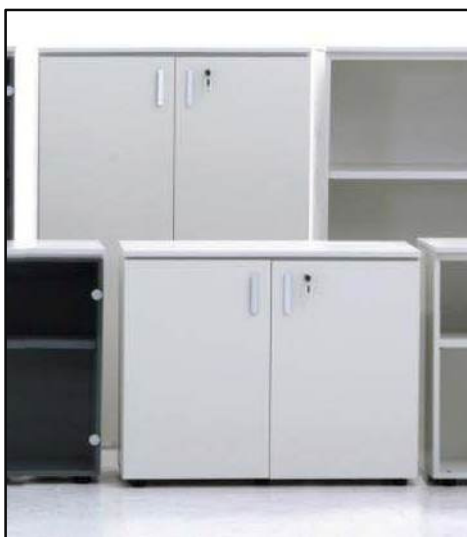
Biblioteca baja adelante y alta atrás.