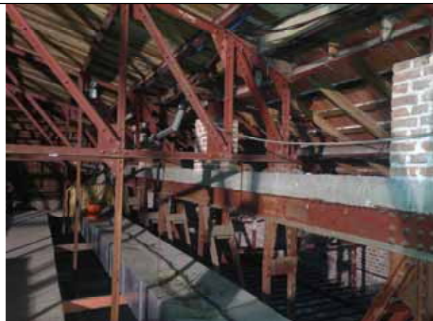
Buhardilla sobre Paraninfo