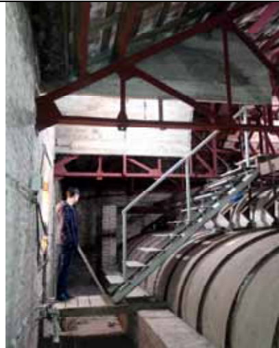
Buhardilla sobre Consejo Superior