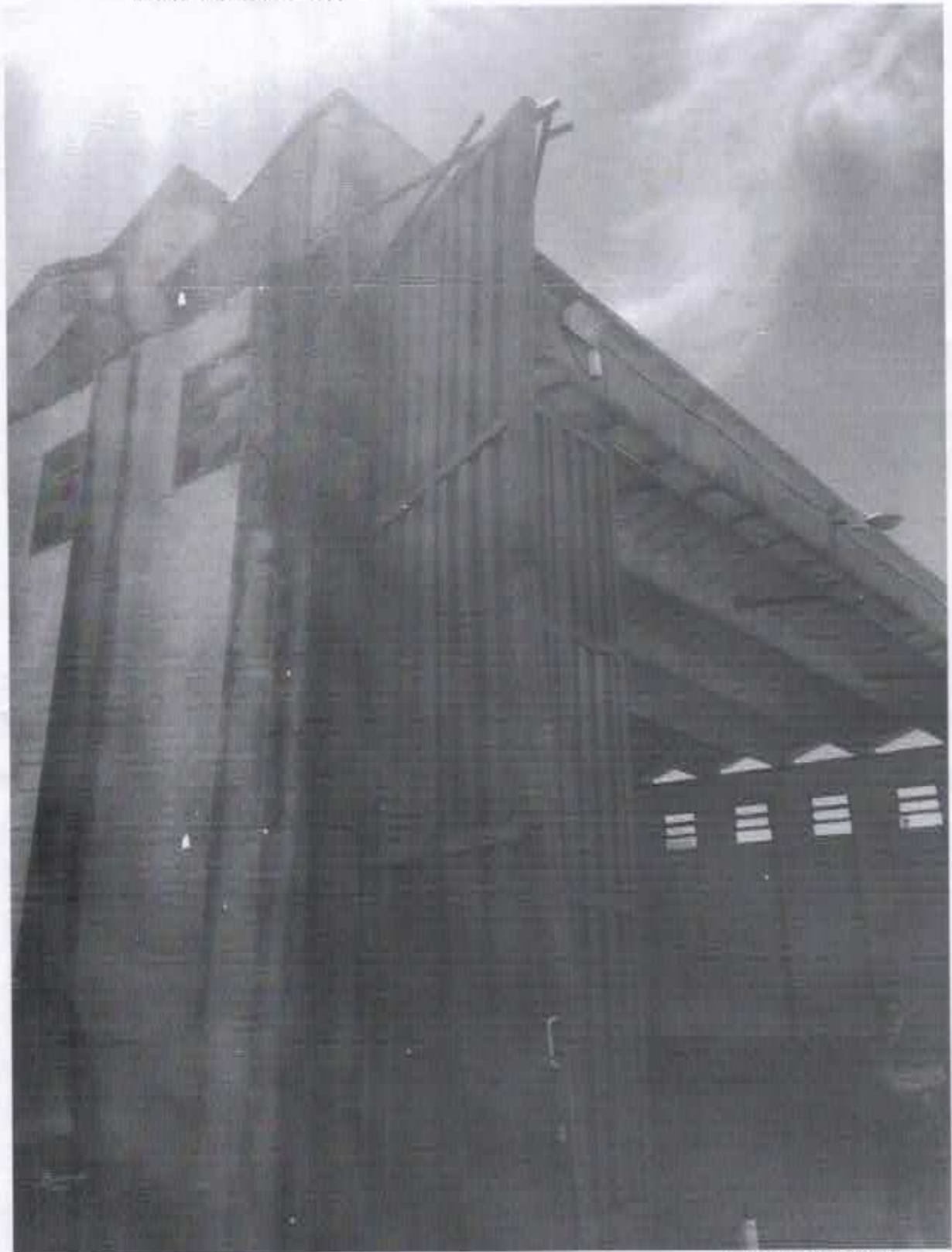
CAP Ruben DELGADO 5