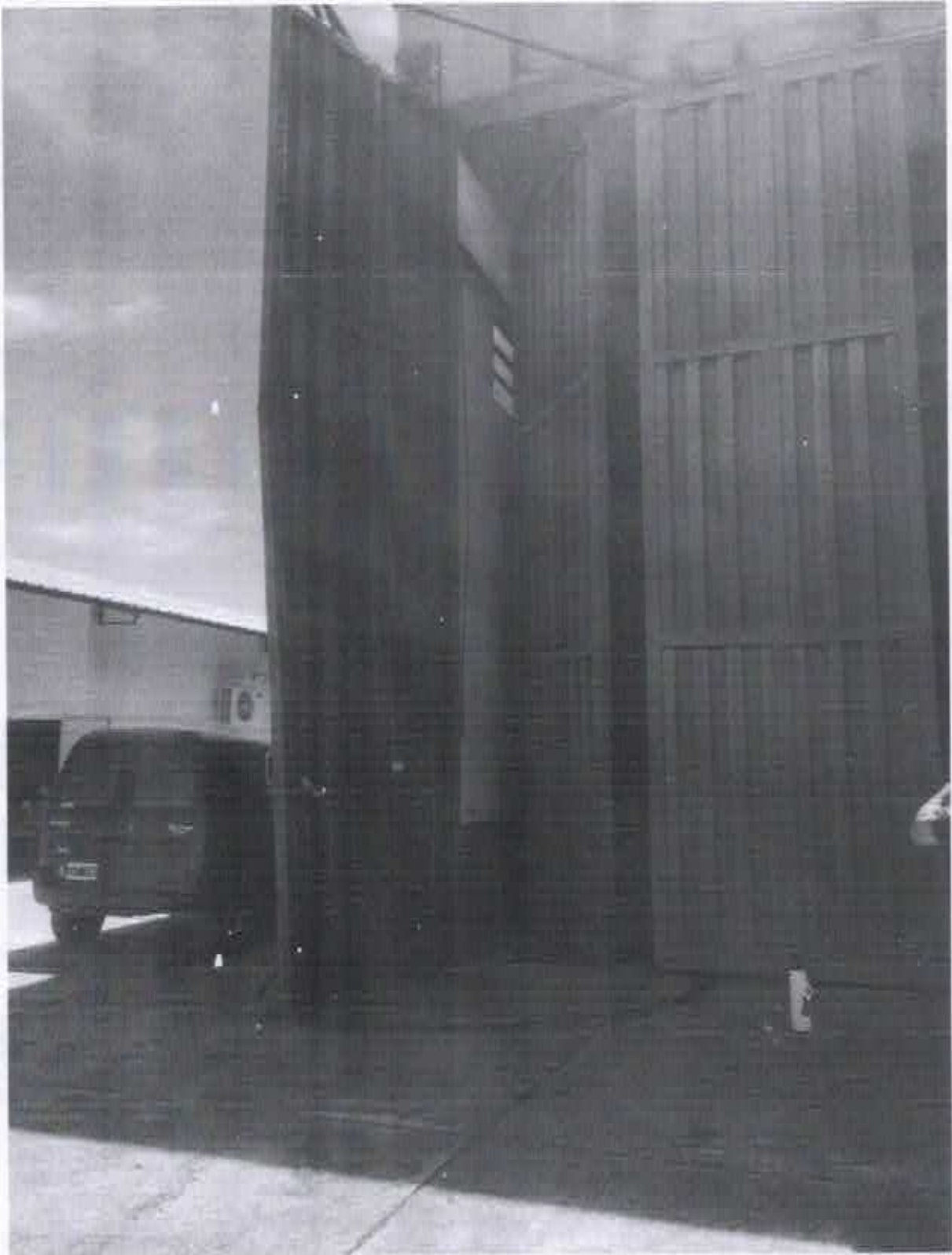
CAP. Roben DELGADO 4

FUERZA AÉREA ARGENTINA DIRECCION GENERAL DE MATERIAL DIRECCION DE INFRAESTRUCTURA DELEGACION ZONA NORDESTE