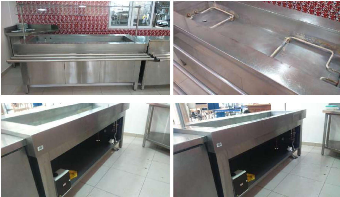
Imágenes ilustrativas de referencia

Se deberá proveer de un lunchonette eléctrico para platos calientes que deberán cumplir mínimamente con las siguientes características técnicas: