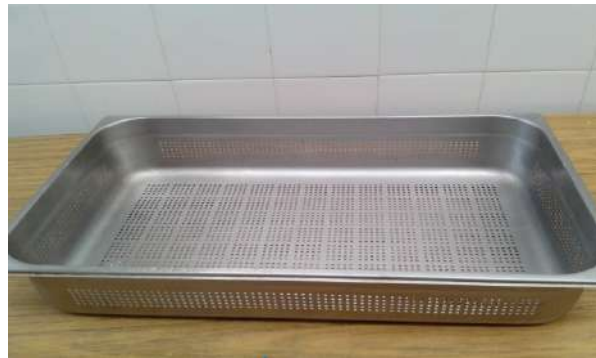
Imagen a modo ilustrativo